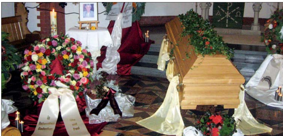
Aufbahrung in der Christuskirche Neubeckum