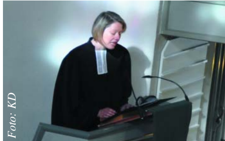
Bei der Antrittspredigt

ganz neue und wichtige Impulse auch für unsere Gemeinde hervorgehen. Ein guter Anfang jedenfalls ist gemacht. KD