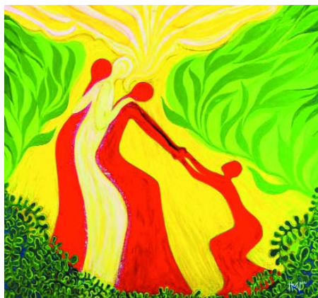
Themenbild „Justice“ von Hanna Cheriyan Varghese